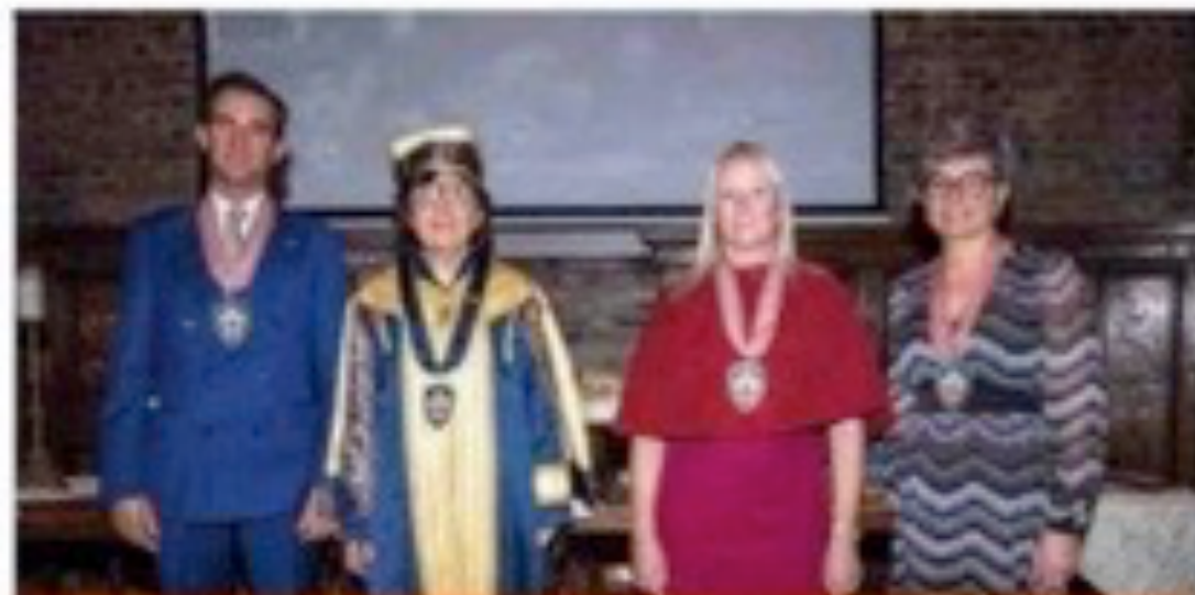
I tre nuovi postulanti dell'ordine

Il Consiglio Reggitore ha indossato le nuove divise, già presentate durante l'incontro di settembre, mentre la Banda musicale di Diano d'Alba ha intrattenuto gli ospiti eseguendo al-